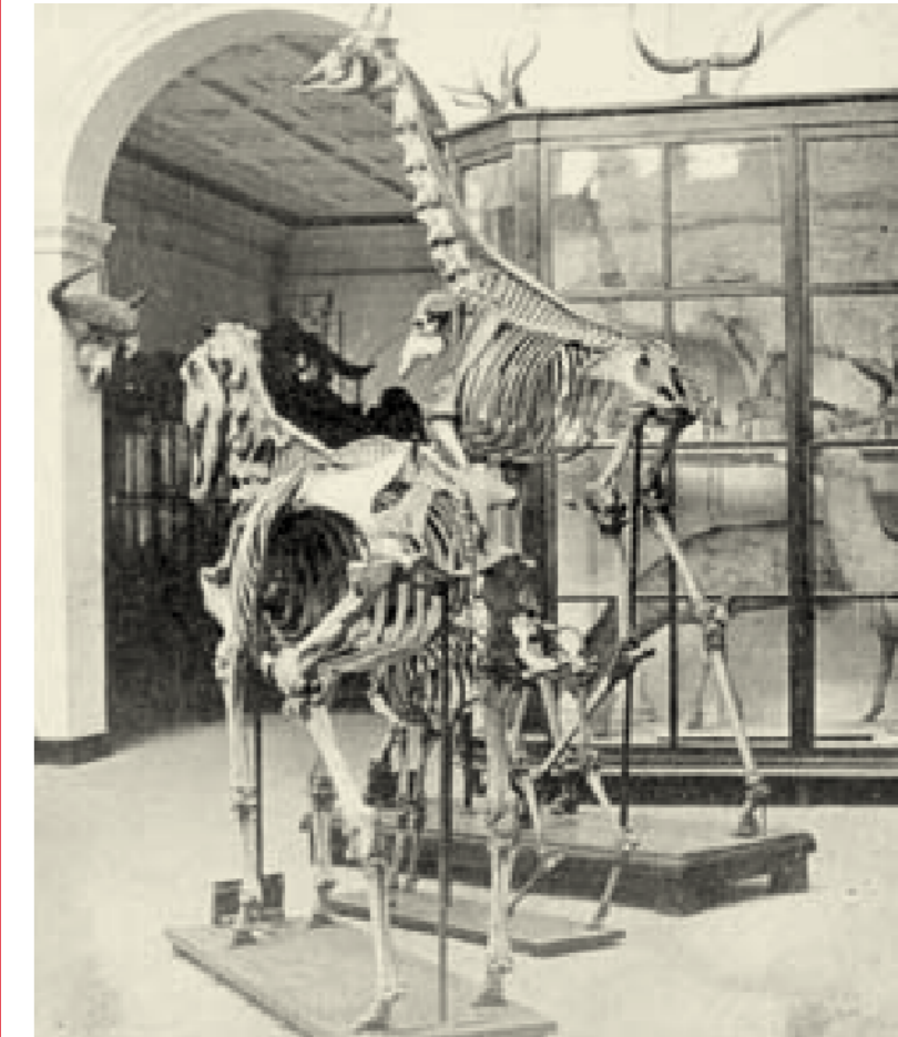
Het Museum van Natuurlijke Historie