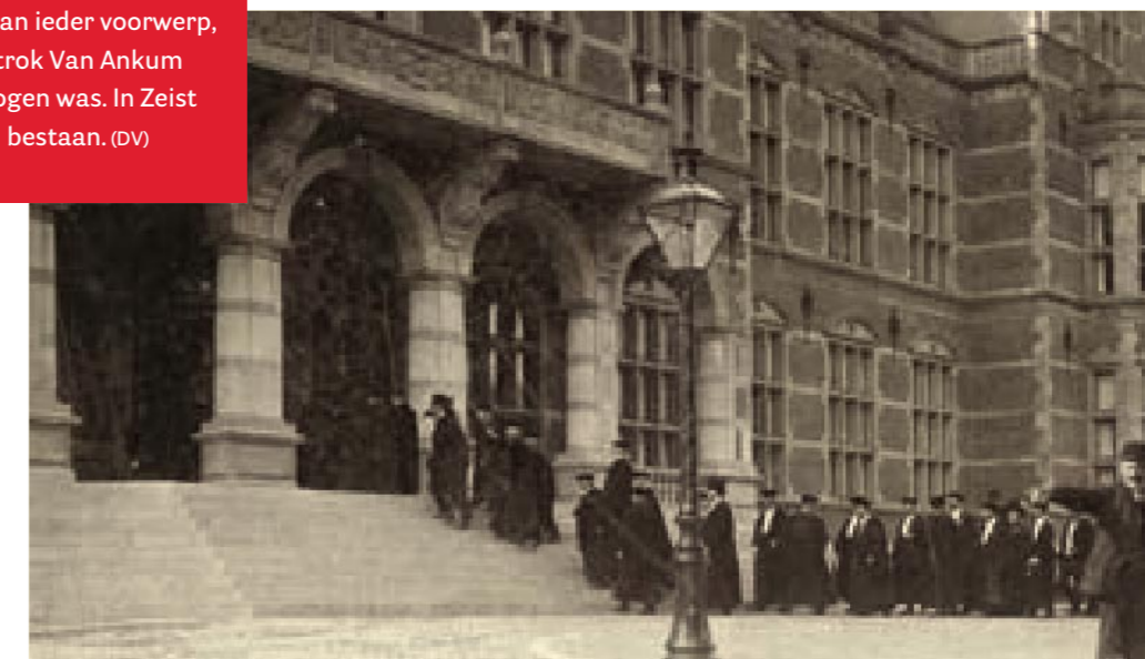
Het derde Academiegebouw dat in 1909 de deuren opende